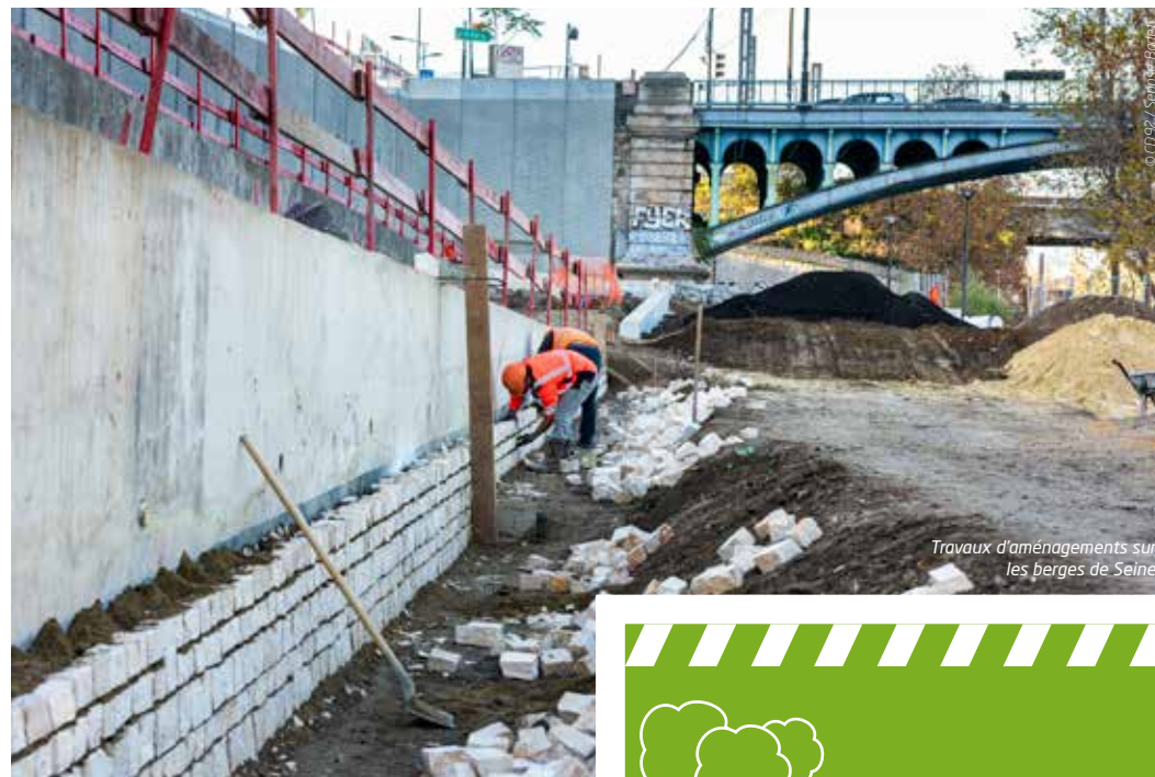
Travaux d'aménagements sur les berges de Seine

Afin de bénéficier d'une météo favorable, le revêtement de la chaussée sera mis en œuvre en mars, achevant ainsi un projet ambitieux et de long cours.