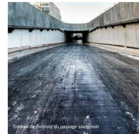
Travaux de finitions du passage souterrain

Afin de dynamiser le visuel des parois du passage souterrain, celles-ci seront équipées d'un parement rétro-éclairé, avec une alternance entre des panneaux lumineux et des panneaux pleins.