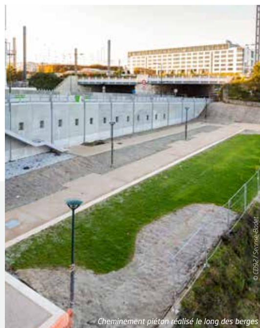
Cheminement piéton réalisé le long des berges

/// Par ailleurs, la reprise des travaux devant le cimetière de Levallois permettra de finaliser la promenade piétonne au profit des riverains.