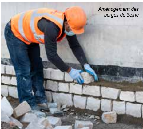
Aménagement des berges de Seine

/// J'aspire à ce que les déplacements se fassent en toute fluidité, mais aussi que le passage souterrain soit pleinement intégré au paysage urbain. L'idéal serait que les différents modes (automobilistes, piétons, cyclistes, trottinettes, etc) puissent se partager l'espace, en ayant chacun une zone dédiée, aménagée et sécurisée. J'espère aussi que nous parviendrons à faire en sorte que les riverains prennent totalement possession des lieux, qu'ils les pratiquent, qu'ils les vivent (en se divertissant ou en allant simplement se promener sur les berges).