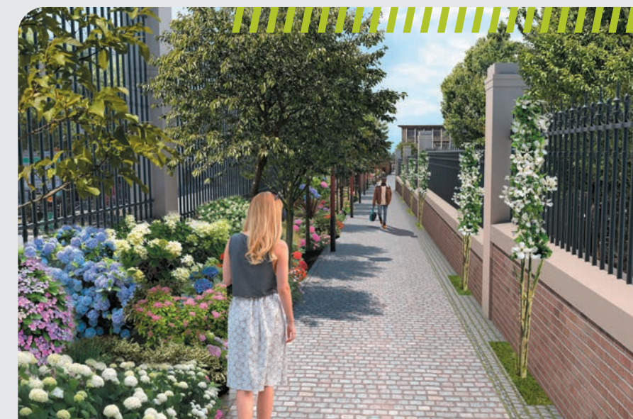
Vue de la future Promenade des Jardins

des feux tricolores seront créés. Pour mieux accueillir les mobilités douces, une continuité cyclable et piétonne sécurisée sera aménagée. Le projet intègre également un aménagement paysager de 7 000 m 2 devant la Cité de la Céramique, pour un environnement plus vert.