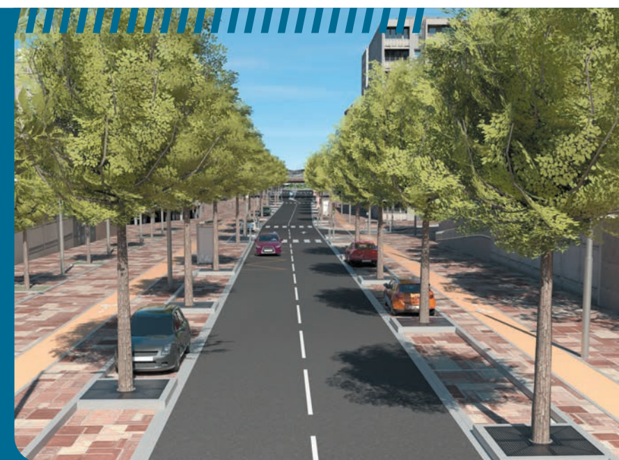
Vue de la future RD 910 réaménagée

La RD 910 (dite « Voie royale »), qui traverse les communes de Sèvres, Chaville, Saint-Cloud et Boulogne-Billancourt, fait également l'objet d'un projet de réaménagement. En effet, à Sèvres et Chaville, un tronçon de 3,8 km sera requalifié en boulevard urbain, grâce à des aménagements paysagers qualitatifs et à une place de choix donnée aux mobilités douces. Ainsi, l'espace public sera mieux partagé au profit des piétons et cyclistes, via la création de larges espaces piétons et de pistes cyclables continues et sécurisées. Le projet vise également à renforcer le tissu économique local (grâce à la création de contre-allées incluant du stationnement et des aires de livraisons) et à faciliter l'accès aux équipements publics.