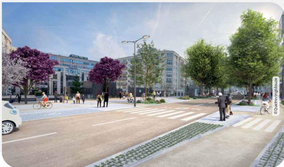
Photomontage du projet de réaménagement de la RD 910 (Atrium à Chaville)

La circulation automobile, piétonne et cycliste sera temporairement perturbée par des interventions ponctuelles. Les arrêts de bus de la ligne 171, situés sur les zones de travaux, seront momentanément déplacés. Le Département et la RATP informeront les usagers des modifications au fur et à mesure de l'avancée des travaux concessionnaires. Les accès aux habitations et aux commerces seront maintenus pendant toute cette période.