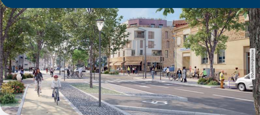
Photomontage du projet de réaménagement de la RD 910 (avenue Roger Salengro à Chaville)

Le Département réaménage la route départementale 910 « Voie Royale » sur les communes de Chaville et de Sèvres, entre la rue des Marais à Viroflay et l'avenue de la Division Leclerc à Sèvres. Ce projet est mené en cohérence avec celui de la revitalisation du cœur de la ville de Sèvres et celui de l'installation d'un nouveau réseau de chaleur urbain pour les deux villes. Entre mi 2025 et 2028, des travaux "préparatoires" concernant le déplacement des réseaux souterrains à Chaville et Sèvres auront lieu.