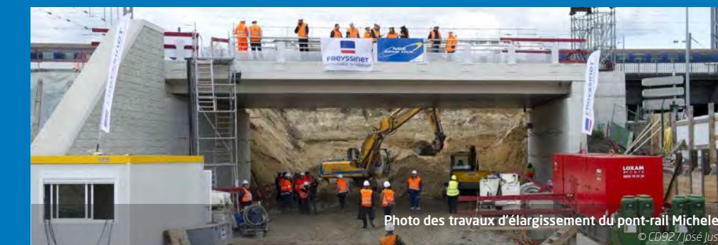
Photo des travaux d'élargissement du pont-rail Michelet.

Ces travaux ont constitué une étape essentielle à l'aménagement de la RD 1, puisque l'ouvrage permet le passage des nouvelles voies routières sous les voies ferroviaires. Ils ont été financés par le Conseil départemental des Hauts-de-Seine. Les travaux d'élargissement les plus importants se sont terminés en décembre 2014, ils avaient duré 2 ans. Puis, des travaux de parachèvement ont été réceptionnés en novembre 2016 (assainissement complémentaire, remise en état des abords).