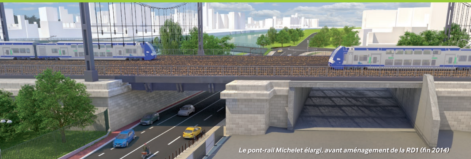
Le pont-rail Michelet élargi, avant aménagement de la RD1 (fin 2014)

Une étape essentielle à l'aménagement de la RD1 sur les communes de Clichy-la-Garenne et de Levallois-Perret