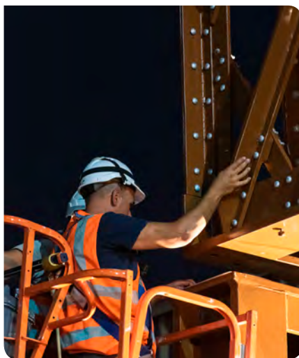
Pose de l'habillage métallique de l'A86