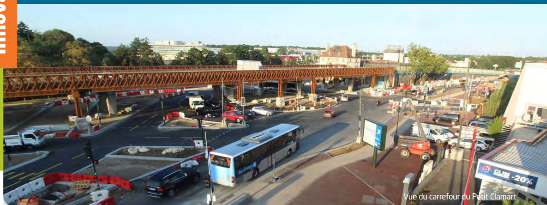
Vue du carrefour du Petit-Clamart

Les travaux d'aménagement sont presque terminés. Il est maintenant temps de réaliser les plantations de végétaux, phase qui marque l'aboutissement des travaux. Les essences choisies attestent d'un soin particulier donné à l'environnement végétal de la nouvelle RD 906, notamment à travers la réalisation d'un véritable jardin méditerranéen au cœur du carrefour du Petit-Clamart. Dès octobre, les travaux d'aménagement urbain seront entièrement terminés et les automobilistes, tout comme les piétons et cyclistes, pourront profiter d'un boulevard urbain apaisé et sécurisé.