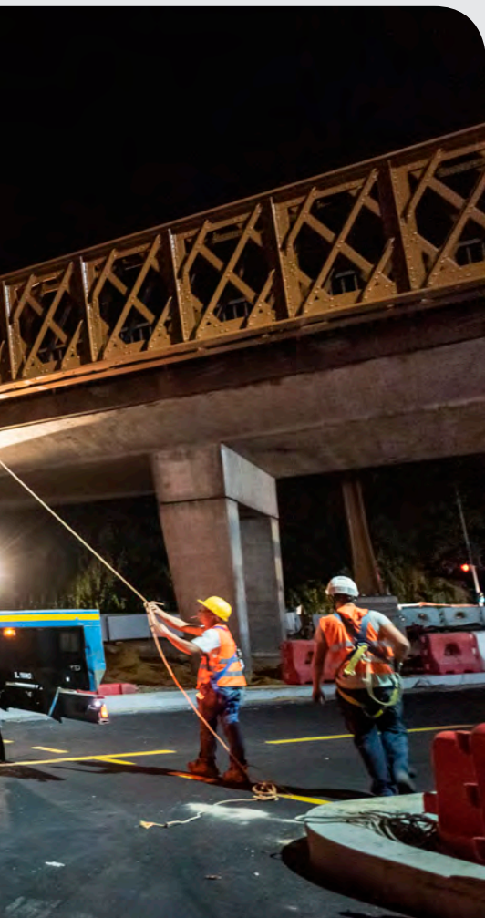
Pose de l'habillage métallique de l'A86

Ces choix d'aménagement urbain donnent de la grandeur à la structure et confortent l'idée d'une entrée de ville plus esthétique.