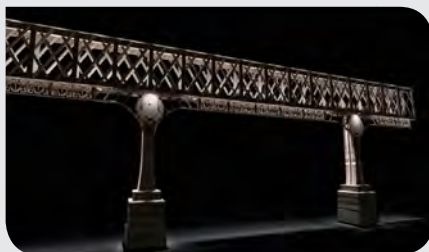
Image 3D de l'éclairage de la structure métallique