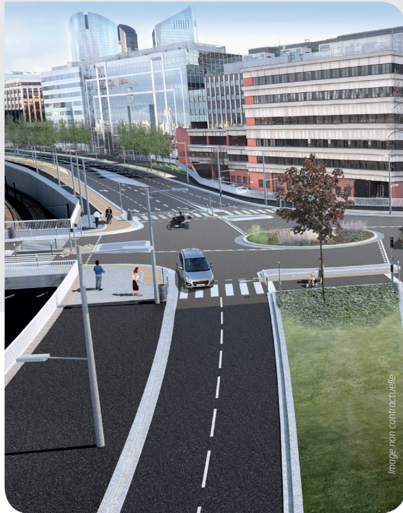
Perspective de la future RD 914 au droit du carrefour Arago

Pour toute information complémentaire, vous pouvez contacter le Département des Hauts-de-Seine :