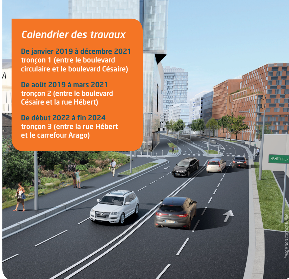
Perspective de la future RD 914 au droit du carrefour avec la rue de Vimy

De début 2022 à fin 2024 tronçon 3 (entre la rue Hébert et le carrefour Arago)