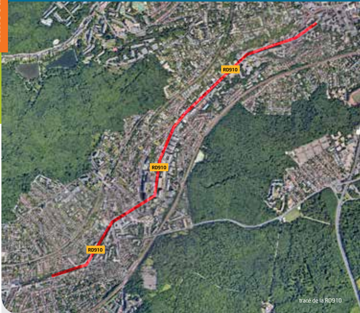
tracé de la RD910

Le Département des Hauts-de-Seine souhaite requalifier la RD 910 sur les communes de Chaville et Sèvres. Des aménagements paysagers qualitatifs transformeront cette voie de 3,8 km en un boulevard urbain dont les abords seront végétalisés. Aussi, le projet prévoit de donner une meilleure place aux circulations actives (piétons et deux-roues) tout en assurant une circulation fluide en particulier pour les bus.