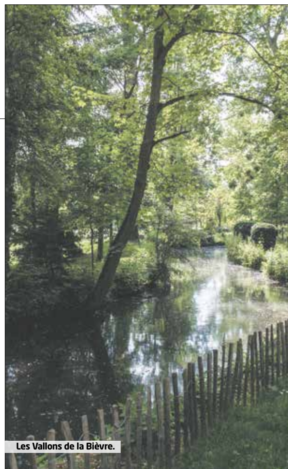
Les Vallons de la Bièvre.

L'ensemble des dates sur www.hauts-de-seine.fr