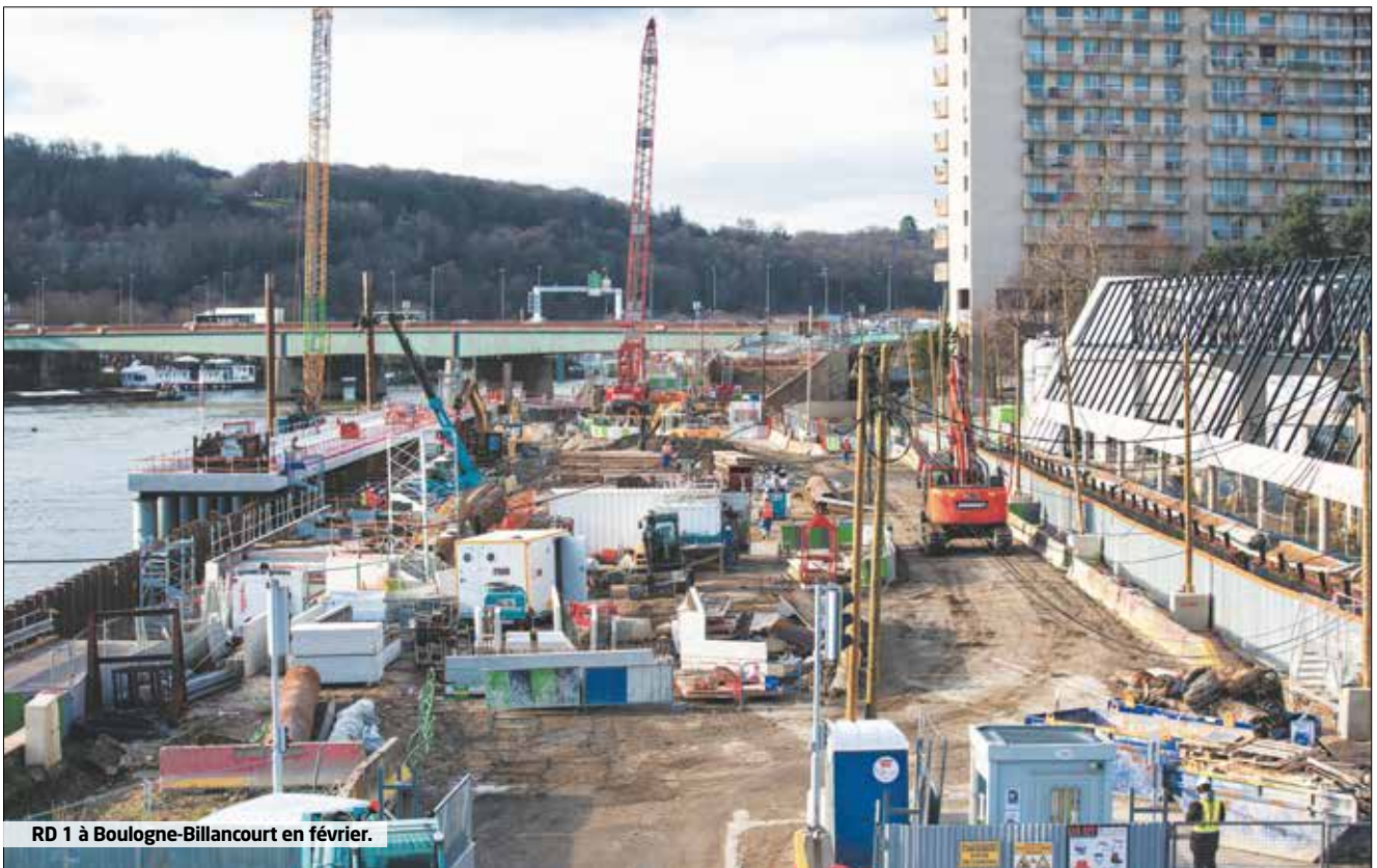
RD 1 à Boulogne-Billancourt en février.

de mars sur la voirie et dans les parcs départementaux