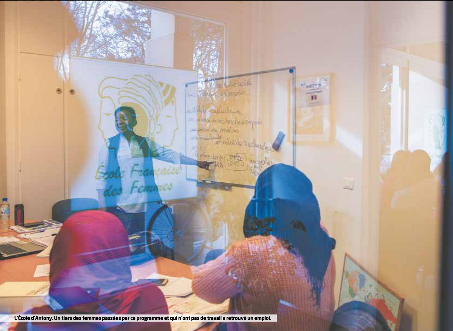
L'École d'Antony. Un tiers des femmes passées par ce programme et qui n'ont pas de travail a retrouvé un emploi.