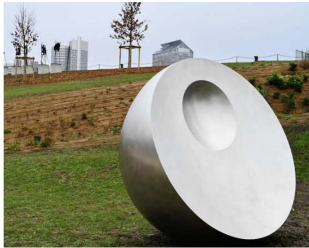
Gauche : Parc départemental de la Roseraie, à Châtenay-Malabry