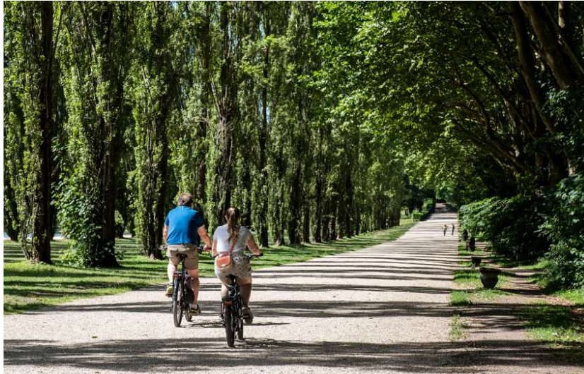
Balade en vélo au Parc départemental de Sceaux

La participation de la Mission Tourisme du Département des Hauts-de-Seine à ce salon s'inscrit dans ses missions globales, notamment le développement de l'attractivité du territoire et la valorisation de sa qualité de vie , en particulier du point de vue des espaces verts et de l'environnement altoséquanais. Le Département a ainsi l'opportunité d'informer, de fidéliser et d'attirer de nouveaux publics vers des formes d'activités touristiques différentes ou méconnues.