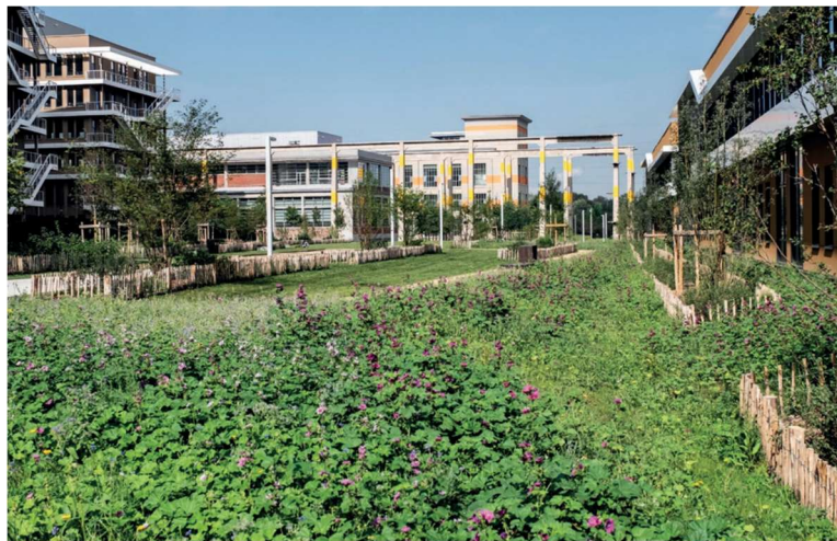
Vue de l'extension A des Jardins des Papeteries, Parc départemental du Chemin de l'Île, à Nanterre

Plus d'informations : hauts-de-seine.fr/la-strategie-departementale-des-espaces-de-nature