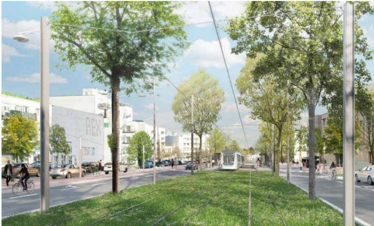
Image non contractuelle / Crédit : © A. Faugères / concepteurs : Attica et Richez-Associés.

La plateforme est ensuite couverte, de part et d'autre des rails, d'un revêtement végétal. Cette végétalisation s'inscrit dans une démarche de requalification de l'espace urbain le long du tracé. Elle s'accompagnera également de plantation d'arbres.