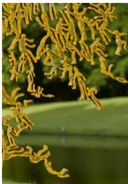
Autumn Reflection , détail, 2007

« Le premier arbre humain que j'ai créé en 2003 était une commande pour le Yad Vashem, le musée de l'Holocauste à Jérusalem. Il rend hommage et commémore les résistants de la Seconde Guerre mondiale, qui se cachaient dans les forêts pour échapper ainsi à l'ennemi en se fondant dans les bois parmi les arbres. Cet acte, de se laisser absorber par la nature, de s'y perdre pour survivre m'a toujours fasciné ». Zadok Ben-David