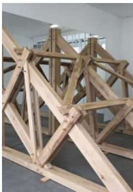
Tout contre , 2018 Bois de chêne, 240 x 310 x 220 cm

«Pour l'exposition Les Extatiques , je me suis penché sur l'extase amoureuse, et plus précisément ce qui la précède, la séduction. Il y a une interaction qui m'intéresse particulièrement entre une œuvre et celle ou celui qui la regarde. Une tentative de déstabilisation, d'attraction, qui amène parfois à la fascination. Une œuvre cherche à séduire celle ou celui à qui elle s'adresse, selon des codes, des indices, des détours, les appareils d'une culture commune. L'œuvre s'adresse, courtise, s'échappe, se dévoile ou se donne. L'œuvre Pour tes beaux yeux , perchée au-dessus d'une architecture, joue avec le regardeur en reflétant le paysage dans lequel celle ou celui à qui elle s'adresse se trouve.» Stéphane Thidet