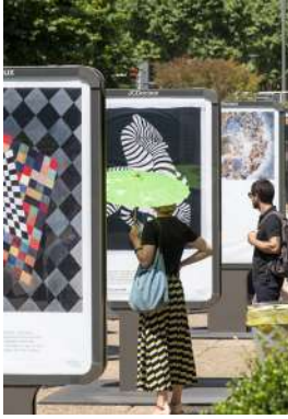
L'exposition dans l'exposition Rien à Voir , Les Extatiques , 2020, œuvres présentées dans les mobiliers JCDecaux, Paris La Défense