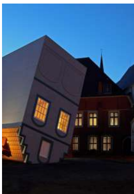
Maison à l'envers, Fantastic, Lille3000, 2012.