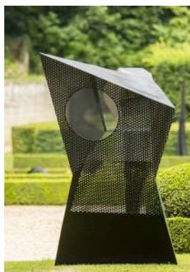
Chambres sensorielles, 2020 Château de Poncé