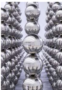
Half Pyramid, Beijing 2020

Sur l'Esplanade de Paris La Défense, Cyril Lancelin présentera une décomposition d'un volume simple, un cube. Il est réalisé d'un assemblage régulier de sphères métalliques réfléchissantes. Le solide est évidé par des passages et des percées. C'est le dessin en trois dimensions d'une partition de plein et de vide. L'artiste invite le visiteur à une immersion dans la matière. La sculpture connecte l'infiniment petit et l'infiniment grand, l'échelle humaine et l'échelle de la ville. C'est une expérience cinétique ouverte sur l'espace public.