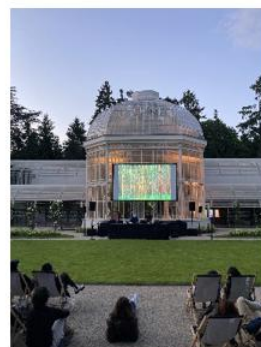
Projection en musique en 2025