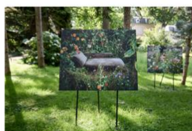
Photographe Siân Davey Festival Mondes en commun, 2025 © CD92 – T. Balaÿ