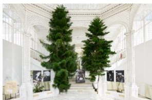
Photographe Aurélie Scouarnec Festival Mondes en commun, 2025 © CD92 – T. Balaÿ

Le festival peut se vivre de différentes manières , que l'on choisisse de contempler chaque photographie, de la mettre en regard avec une image des Archives de la Planète , de s'interroger sur le monde, ou de flâner tranquillement dans le jardin en se laissant surprendre par de belles images, parfois étonnantes. « Les expositions dans le jardin sont, d'une certaine manière, imposées au public qui les visite », précise Sylvie Jumentier, présidente de l'association des Amis du musée. « Les gens viennent ici pour trouver une certaine sérénité. Il ne fallait pas provoquer de rupture, mais garder le lien avec l'idée d'inventaire du vivant. »