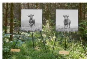
Photographe Ursula Böhmer Festival Mondes en commun, 2025 © CD92 – T. Balaÿ