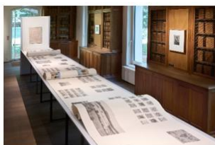
Photographe Claude Iverné Festival Mondes en commun, 2025 © CD92 – T. Balaÿ