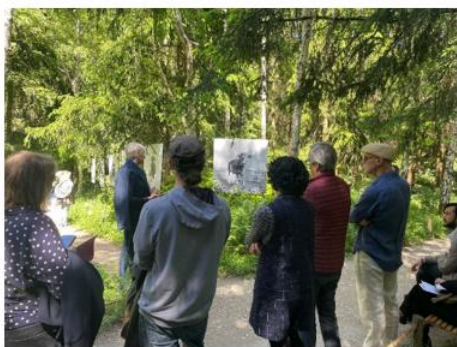
Visite du festival en 2025