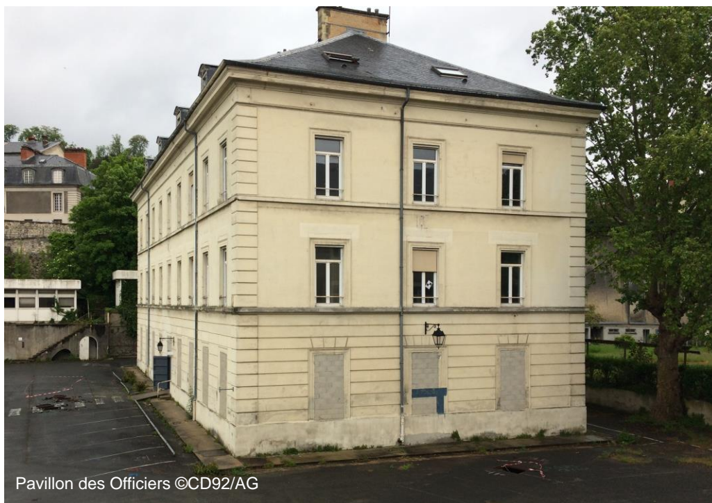
Pavillon des Officiers

Pour faire vivre l'avancée du projet, un pavillon de préfiguration devrait être créé, dédié au projet architectural et muséal, et à la présentation « d'expositions-dossiers ». Il pourrait également accueillir un atelier de restauration visitable.