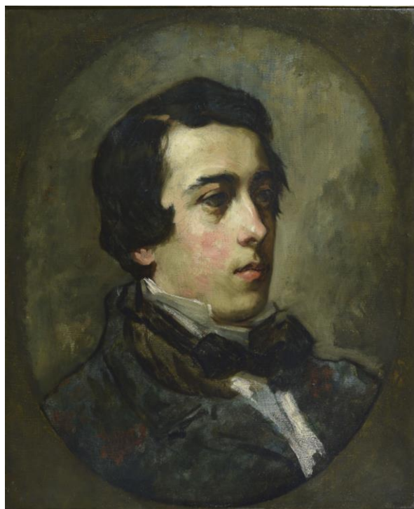
Thomas Couture (1815-1879), Portrait dit de Degas , huile sur toile, 54,2 x 45,5 cm