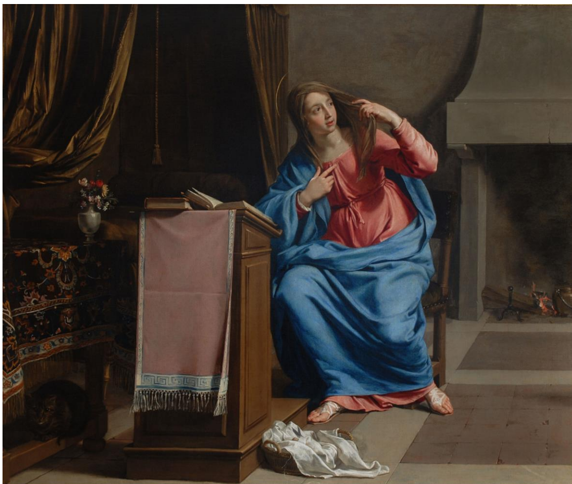
Philippe de Champaigne (1602-1674), Annonciation , huile sur toile, 110 x 134,5 cm

Des expositions temporaires seront également organisées dans un espace dédié.