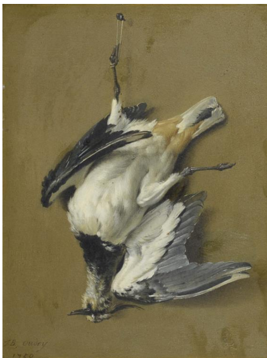
Jean-Baptiste Oudry (1686-1755), Pluvier doré pendu par une patte , huile sur cuivre, signé et daté « JBO1750 », 17,5 x 13,4 cm

Ce cabinet offrira une grande liberté dans la présentation et l'accrochage des œuvres, dans des espaces plus intimes, permettant au public de ressentir l'esprit du collectionneur.