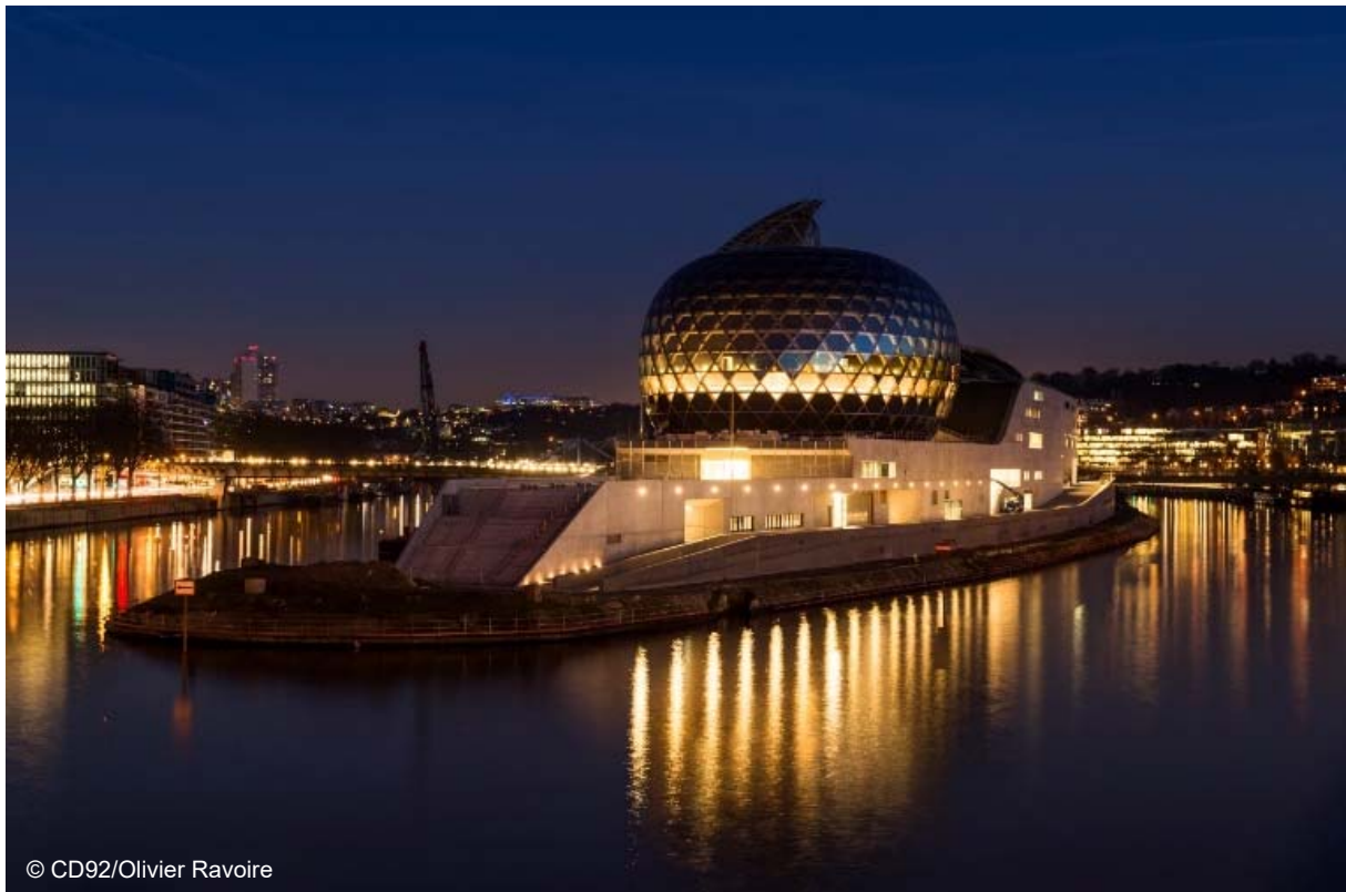
La Seine Musicale à Boulogne-Billancourt Ile Seguin

La Seine Musicale, équipement phare de la politique culturelle du Département des Hauts-de-Seine, rassemble sur la pointe aval de l'île Seguin à Boulogne-Billancourt un auditorium de 1 150 places principalement pour la musique classique, une salle de 4 000 à 6 000 places appelée la Grande Seine, un pôle de répétition et d'enregistrement, des lieux de réception destinés aux entreprises, des commerces et un jardin sur le toit de plus de 7 200 m 2 .