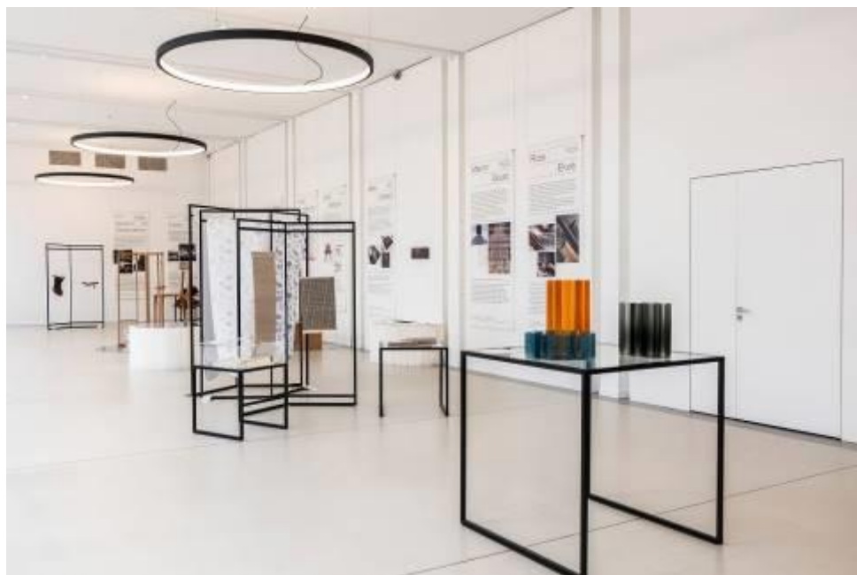
Salle d'exposition CD92 / Julia Brechler