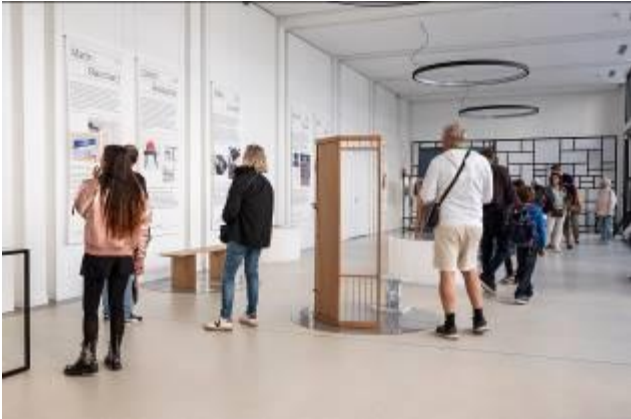
Les espaces communs