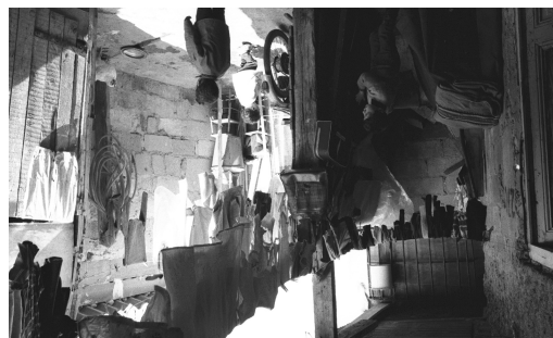
Vue de la cour à partir du auvent