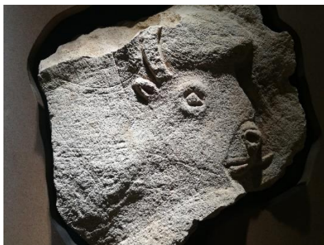
Rocs aux sorciers – Anonyme - © Musée d'archéologie nationale à Saint-Germain-en-Laye

MUMED, Saint-Quentin en Yvelines La Commanderie, Elancourt Musée d'archéologie nationale, Saint-Germain-en Laye Musée de la Fondation Coubertin, Saint-Rémy-lès-Chevreuse