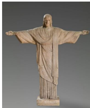
Christ rédempteur – Paul Landowski © Musée Paul Landowski

Programmation complète sur printempsdelasculpture.hauts-de-seine.fr