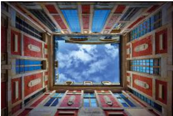
Par la lucarne – Cour de la Reine, Chateau de Versailles