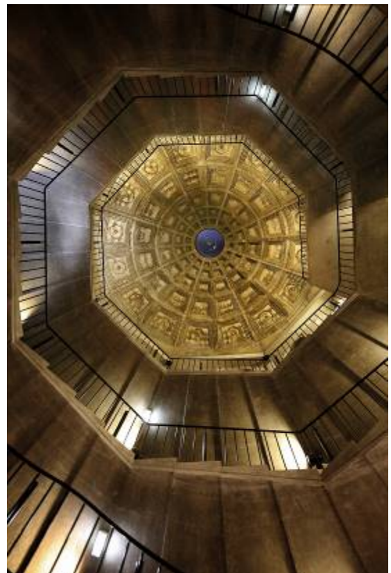
Lever de rideau – Théâtre national, Saint-Quentin-en-Yvelines