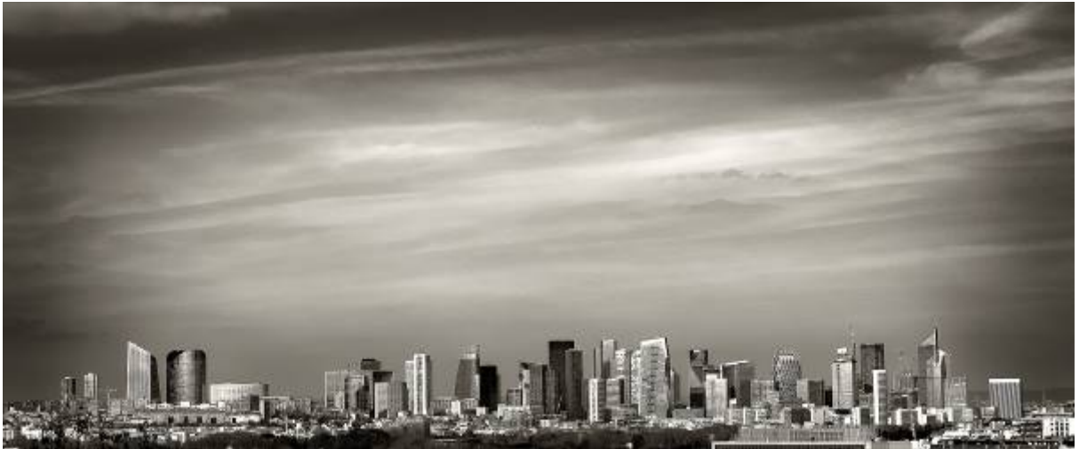
La skyline de la métropole – Panoramique des tours de Paris La Défense