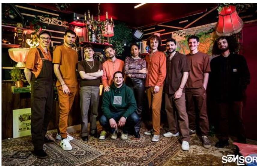
Akata Kolo Orchestra

Premiers noms de la programmation et billetterie : https://chorus.hauts-de-seine.fr/