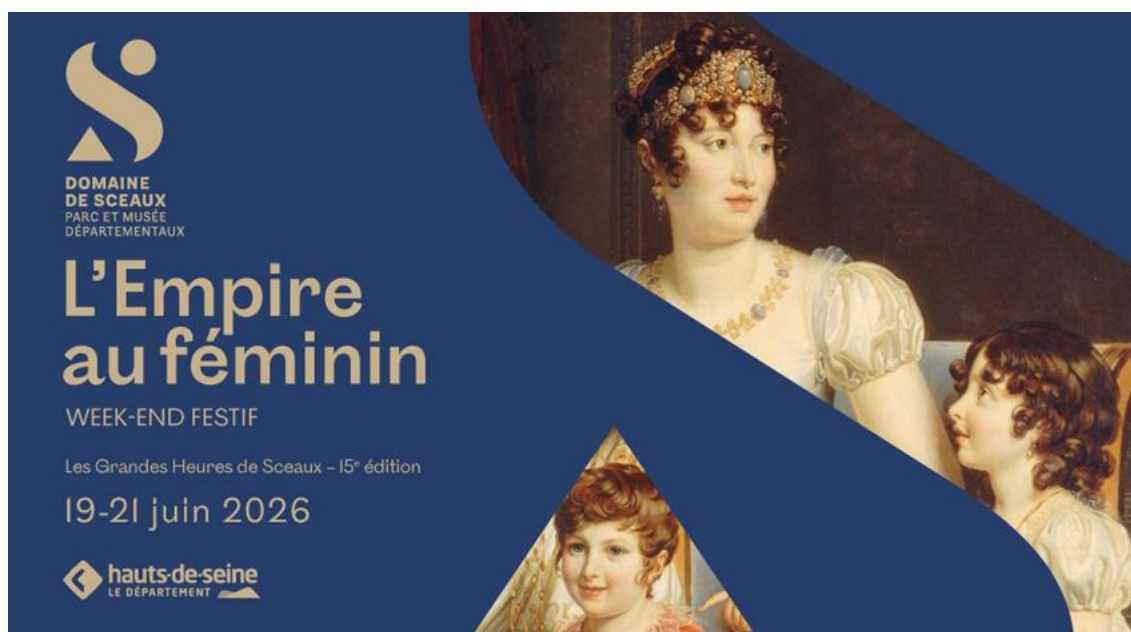
Caroline Murat et ses enfants – Gérard François Pascal Simon, baron (1770-1837)

Pour la 15 e édition des Grandes Heures de Sceaux , le château de Sceaux, musée départemental, propose une programmation consacrée au Premier Empire et centrée sur la personnalité de Caroline Murat, sœur de Napoléon. Ce week-end festif est en lien avec Au cœur des collections , le nouveau temps fort du musée, qui porte cette année sur Caroline Murat au château de Neuilly : un mobilier d'exception , à découvrir au Château du 5 juin au 26 juillet 2026.