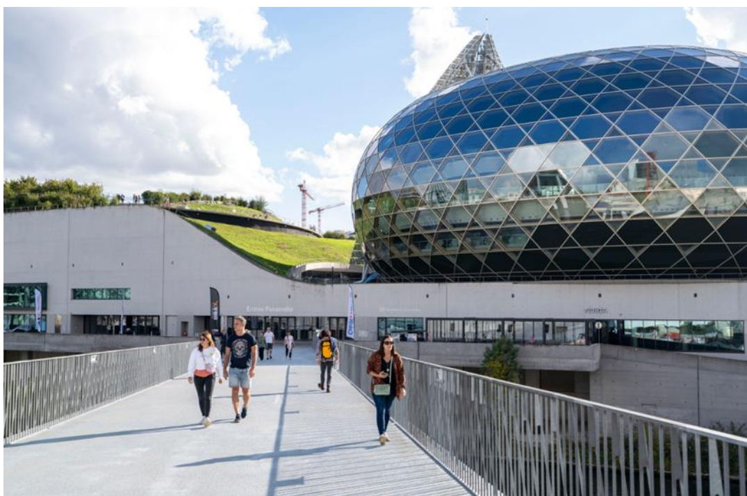
La Seine Musicale durant les Journées européennes du patrimoine 2025

En 2025, le Département des Hauts-de-Seine a poursuivi son ambition de rendre la culture accessible à tous et confirme son rôle essentiel dans la cohésion sociale et l'amélioration de la qualité de vie des Hauts-séquanais.