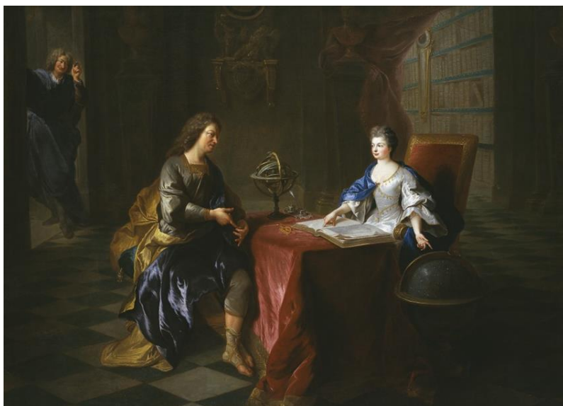
François de Troy, La leçon d'astronomie de la duchesse du Maine au Château de Sceaux , vers 1705