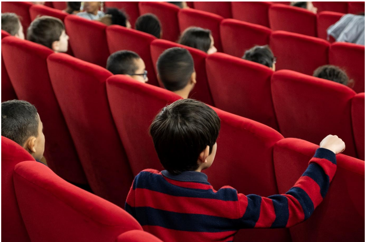
Projection dans le cadre du dispositif Collège au cinéma

→ Lundi 8 juin : Soirée Collège au cinéma « Programme ton film ! » – Cinéma Le Capitole de Suresnes (pour les collégiens participants et leurs familles)