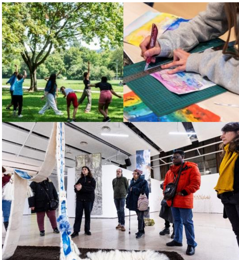
Ateliers et visites dans le cadre des dispositifs d'éducation artistique et culturelle (EAC)