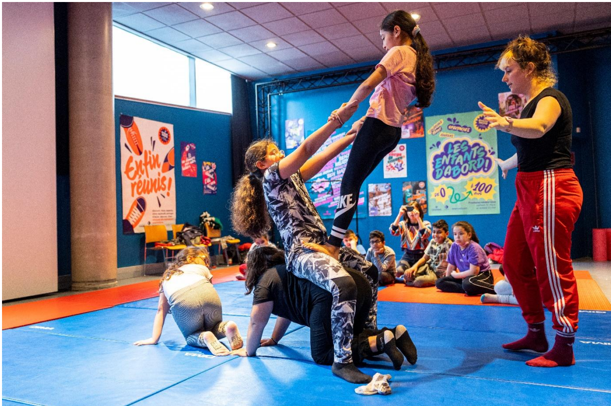
Atelier cirque dans le cadre du dispositif Chemins des arts

→ Vendredi 5 juin : Rencontres « Chemins des arts » – Pour les professionnels et les participants des parcours