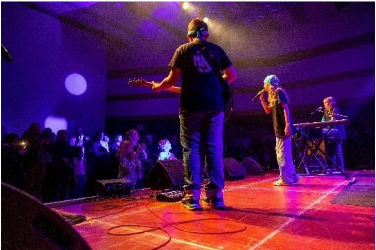
Concert - Journée des Enseignements Artistiques 2024

→ Samedi 06 juin : Journée des Enseignements Artistiques à La Seine Musicale, Boulogne-Billancourt