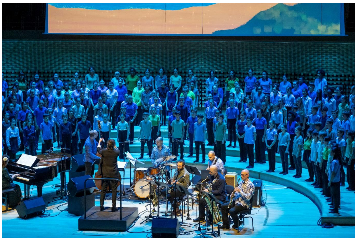
Concert de restitution VOCO 2024-2025

→ Mardi 9 juin et jeudi 11 juin : Concert VOCO à La Seine Musicale, Boulogne-Billancourt – Entrée libre - Réservation obligatoire sur laseinemusicale.com