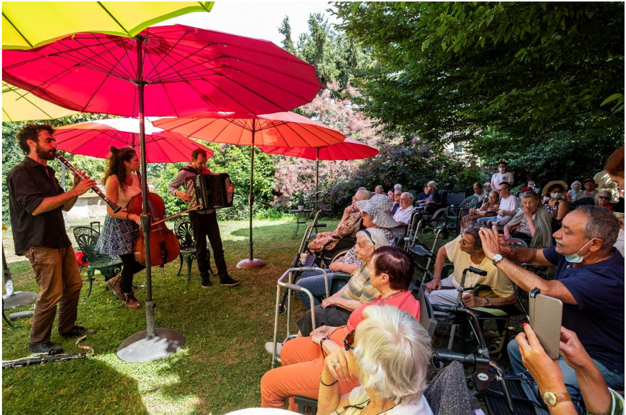
Concert au jardin

→ Mercredi 10 juin : Concert au jardin à la Résidence autonomie Henri Sellier du Plessis-Robinson – Pour les résidents et les Jeunes de la Cité de l'enfance