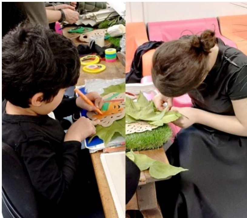
Atelier 1 mois, 1 œuvre

Dans le cadre de cette édition « Hauts les Arts ! », ce dispositif n'est pas représenté mais il participe pleinement au volet d'éducation artistique et culturelle du Département des Hauts-de-Seine tout au long de l'année.