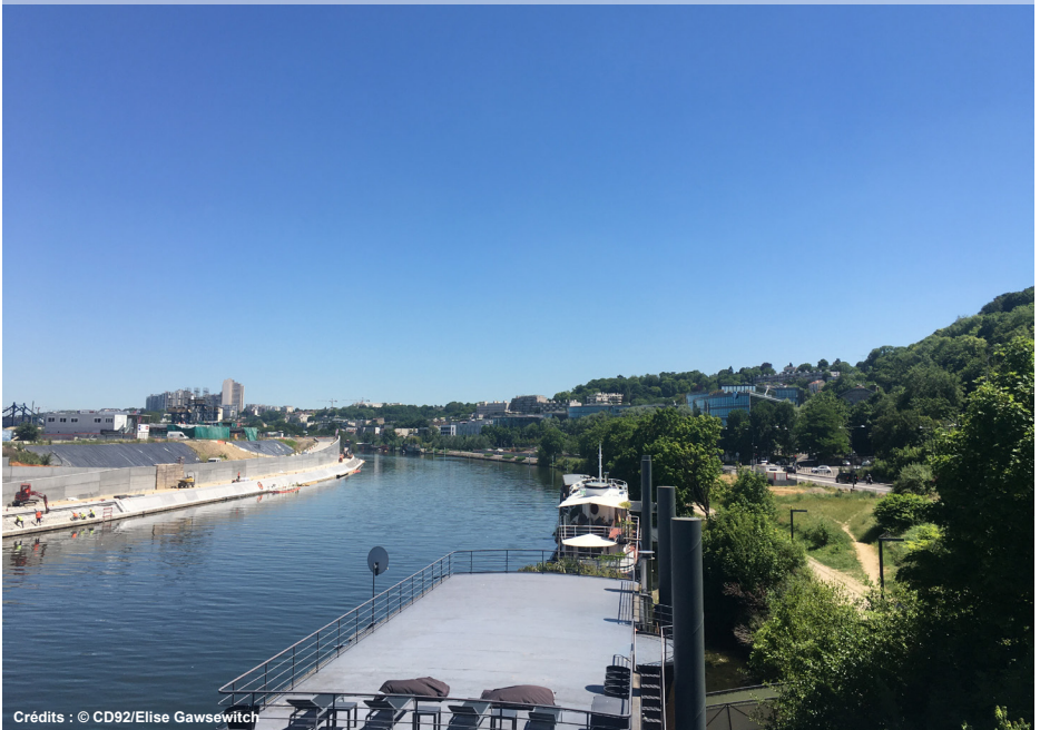
8. Vue depuis la passerelle sur l'Île Seguin (à gauche) et le site (à droite)