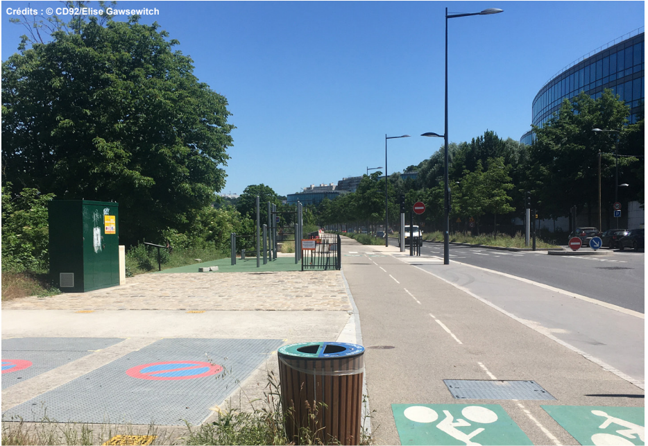
5. Vue des aménagements sportifs et de la piste cyclable au bord de la RD 7