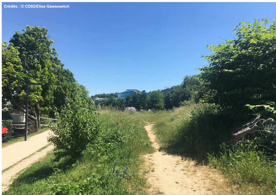
2. Vue du site depuis le fond de parcelle