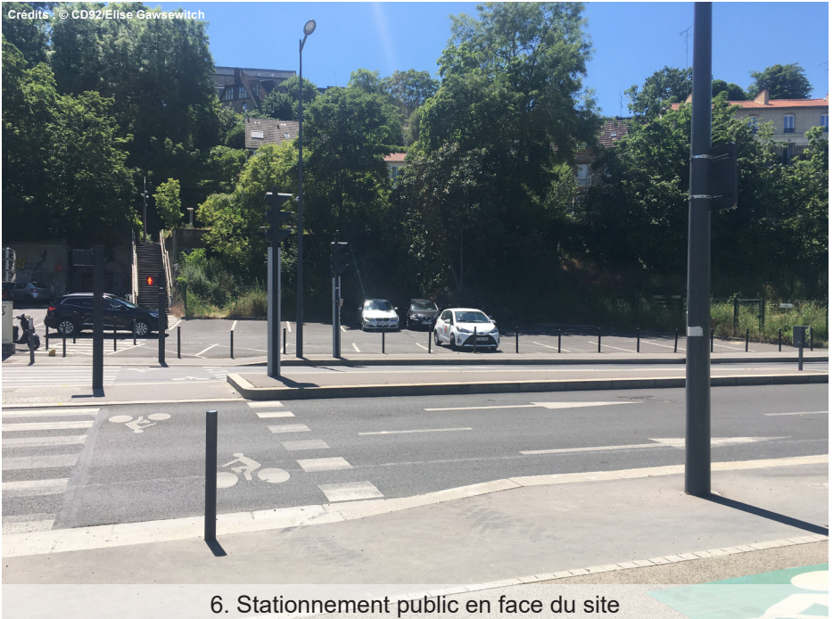
6. Stationnement public en face du site