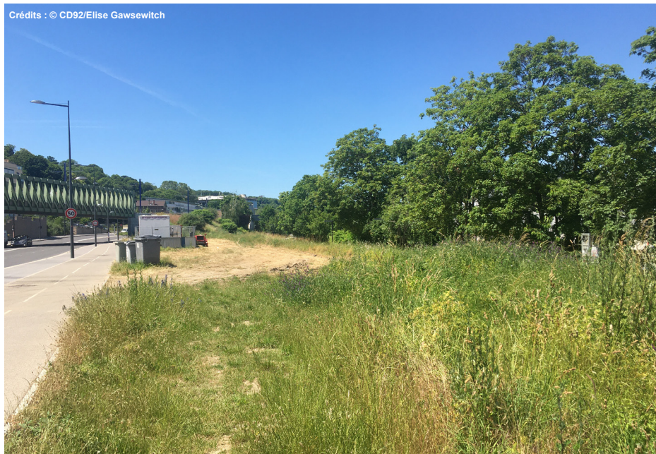
1. Vue depuis l'entrée du site