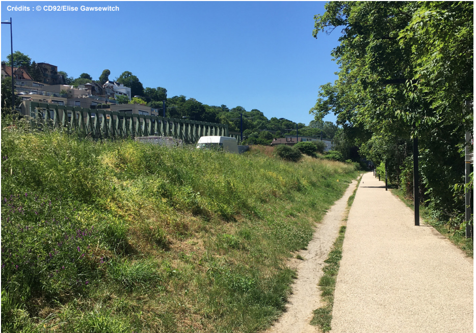
4. Chemin de halage longeant la Seine et le site