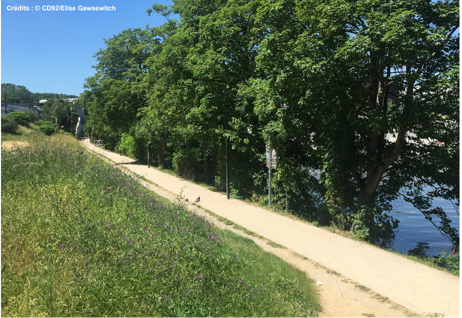
3. Vue du chemin de halage et de la Seine depuis l'entrée du site