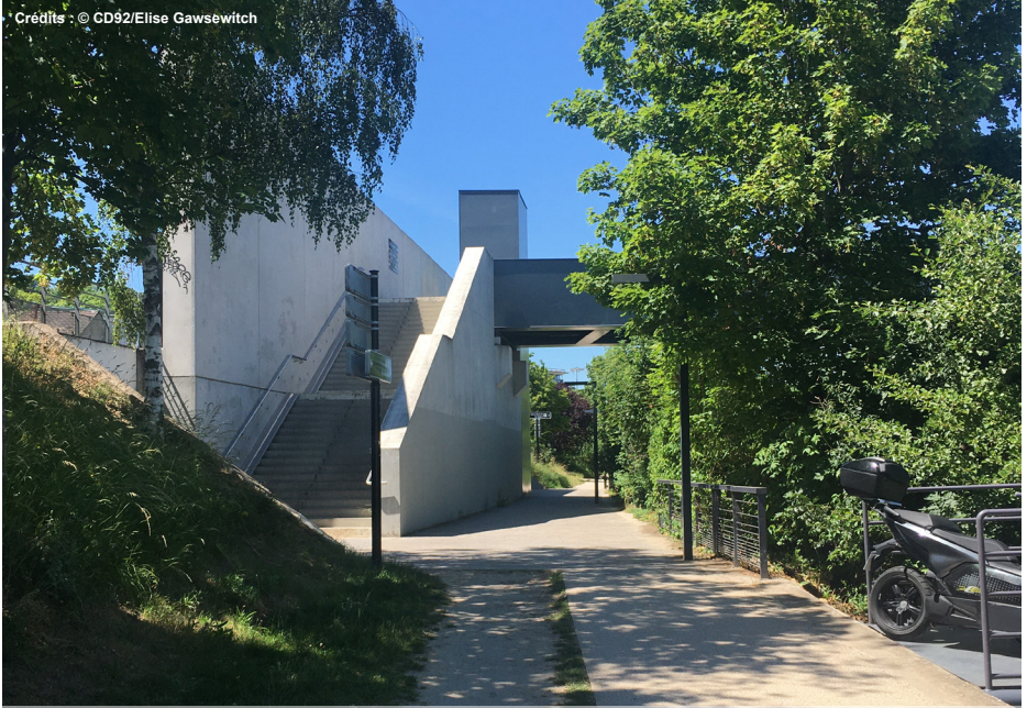
7. Passerelle piétonne côté Sèvres pour accéder à l'Île Seguin