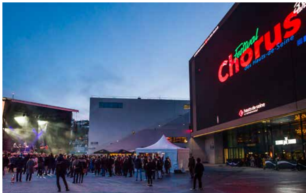
Le Pouce, César