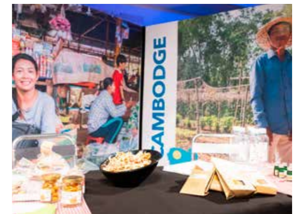
10 ans de la Coopération Internationale, Alternatif de Paris La Défense, novembre 2018

La convention de coopération décentralisée signée en novembre avec la communauté de communes du Zou (Bénin) fixe les orientations de la coopération pour une durée de quatre ans, précise les modalités de concertation et de pilotage ainsi que l'engagement financier du Département. L'intervention départementale se concentre sur la structuration de filières agricoles porteuses de développement, dans la perspective de renforcer à terme l'autonomie des acteurs locaux.