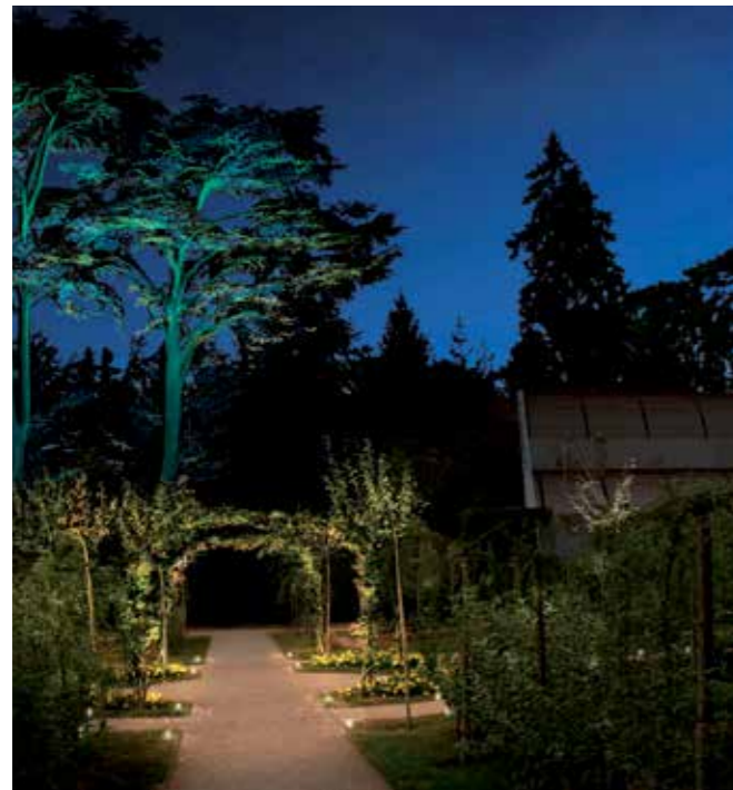
En septembre 2019, le jardin d'Albert Kahn offrira au public ses scènes paysagères emblématiques illuminées.

Avec 375 M€, le Département poursuit sa démarche volontariste en matière d'investissement, source de croissance et d'emploi.