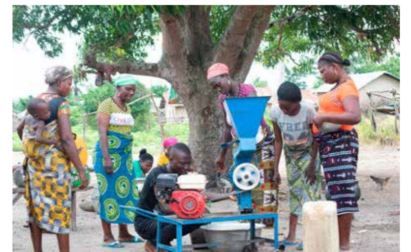
Bénin, soutien à l'entreprenariat agricole