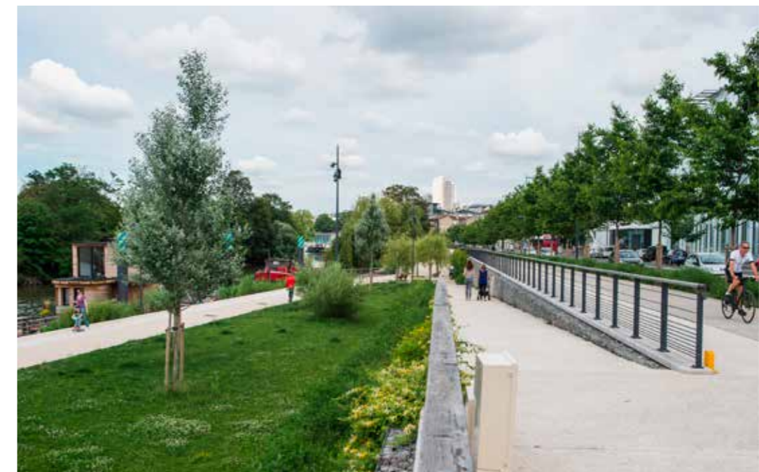
Vue de la Vallée rive gauche, à Meudon

circulent chaque jour sur les aménagements cyclables du Département recensés par 43 compteurs répartis sur le territoire.