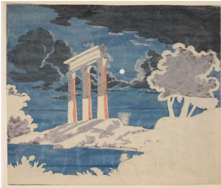
Johann Wolfgang von Goethe (1749–1832) Ruine de temple, vers 1820 Mine de plomb et aquarelle, rehaussée de blanc 388 x 455 mm