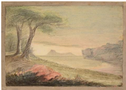
Johann Wolfgang von Goethe (1749–1832) La côte napolitaine, 1816 Mine de plomb et craie colorée 185 x 261 mm