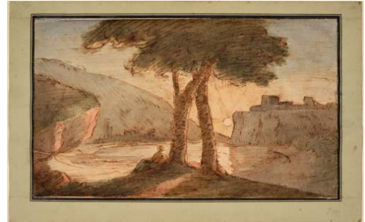
Johann Wolfgang von Goethe (1749–1832) La côte napolitaine à Posillipo, 1808 Plume, encre brune et aquarelle 185 x 311 mm