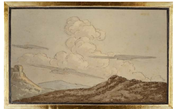
Johann Wolfgang von Goethe (1749–1832) Masse de nuages en forme de tour, vers 1810 Plume et pinceau, encres grise et brune, aquarelle 148 x 223 mm