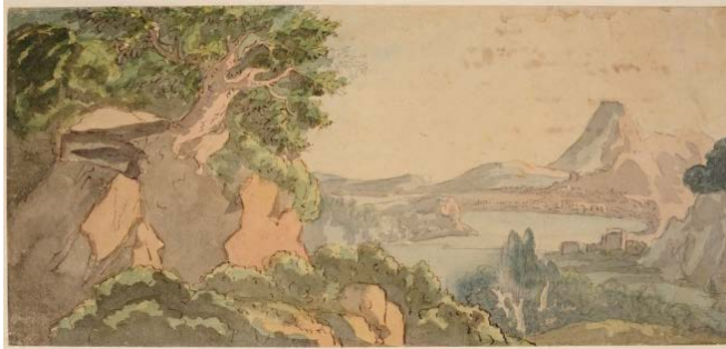
Johann Wolfgang von Goethe (1749–1832) Paysage sicilien, 1808 Mine de plomb, plume, encre brune et aquarelle 160 x 345 mm