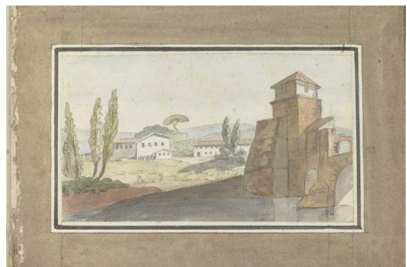
Johann Wolfgang von Goethe (1749–1832) Au Ponte Molle, 1786-1787, Plume et pinceau, encre brune et aquarelle