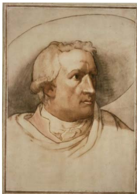
Johann Heinrich Wilhelm Tischbein (1751–1829) Etude de tête -Goethe dans la campagne romaine, vers 1786-1787 ou 1793 Plume, encre brune et aquarelle 572 x 453 mm