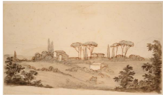
Johann Wolfgang von Goethe (1749–1832) Paysage de la campagne romaine, 1787 Craie noire, plume encre brune, pinceau encre brune et grise 108 x 188 mm