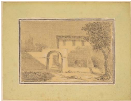
Johann Wolfgang von Goethe (1749–1832) Villa au clair de lune, 1786 Mine de plomb estompée et craie blanche 210 x 331 mm