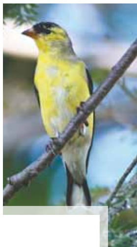
▲ Epipactis helleborine ▶ Chardonneret