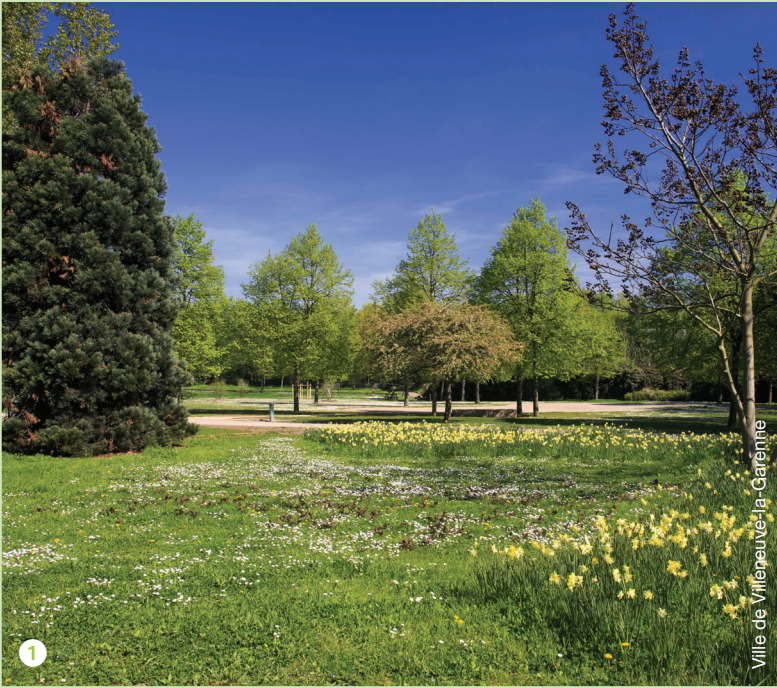
Ville de Villeneuve-la-Garenne