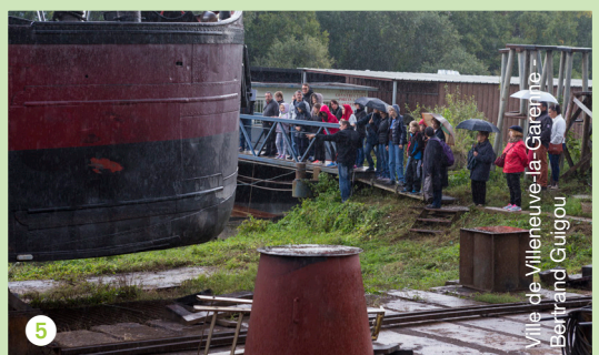
Ville de Villeneuve-la-Garenne - Bertrand Guigou