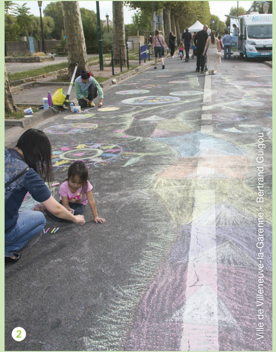
Ville de Villeneuve-la-Garenne - Bertrand Guigou