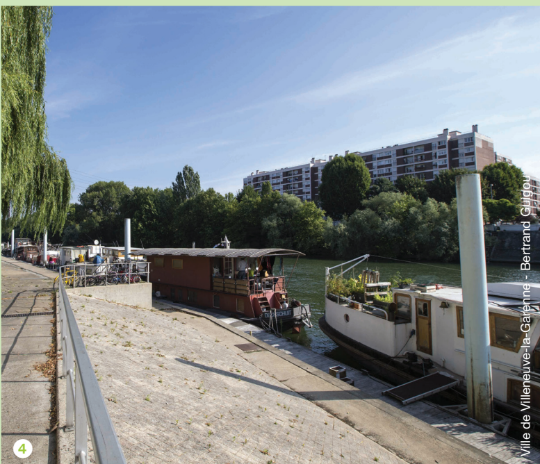
Ville de Villeneuve-la-Garenne - Bertrand Guigou