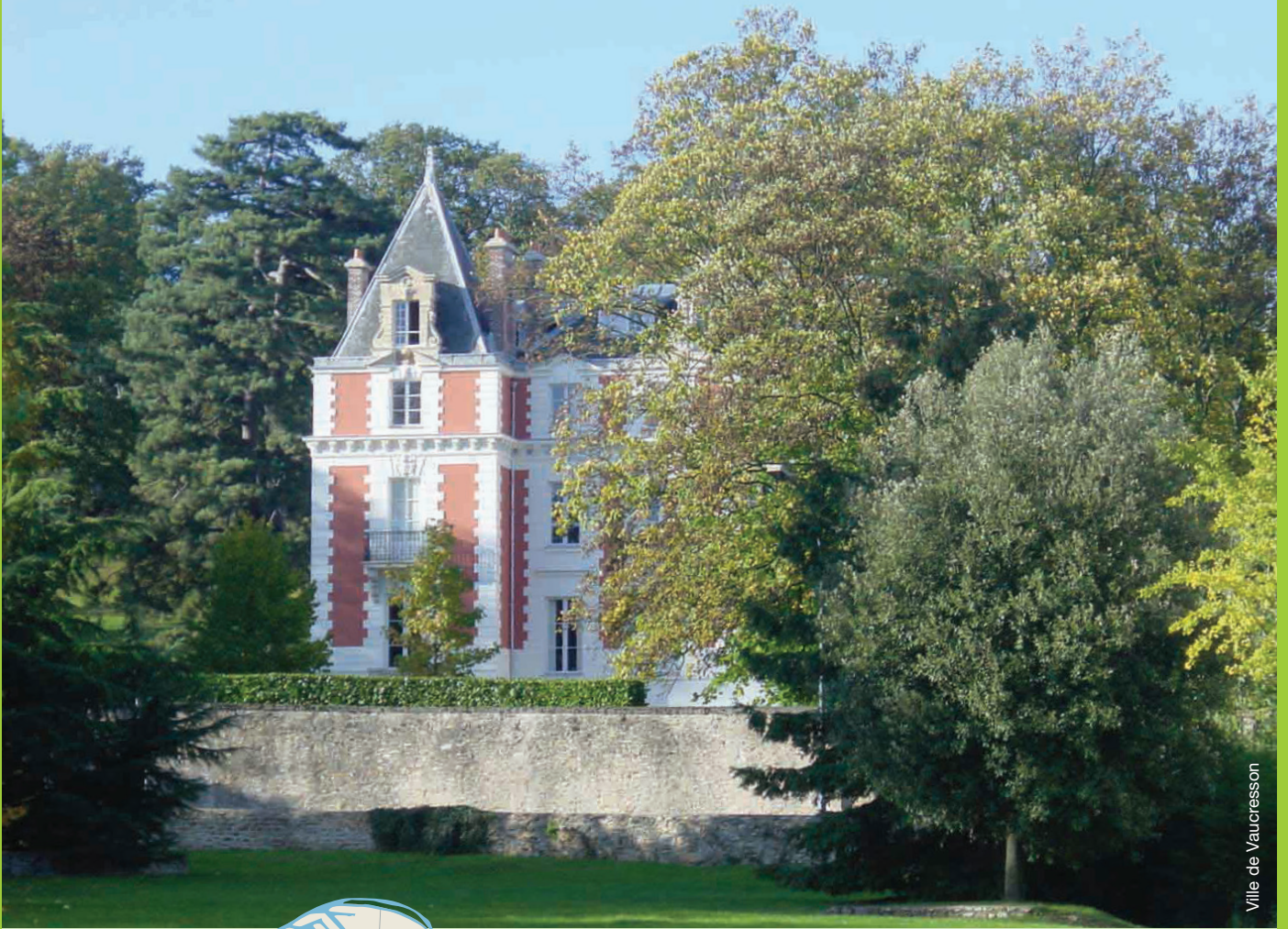
Ville de Vaucresson